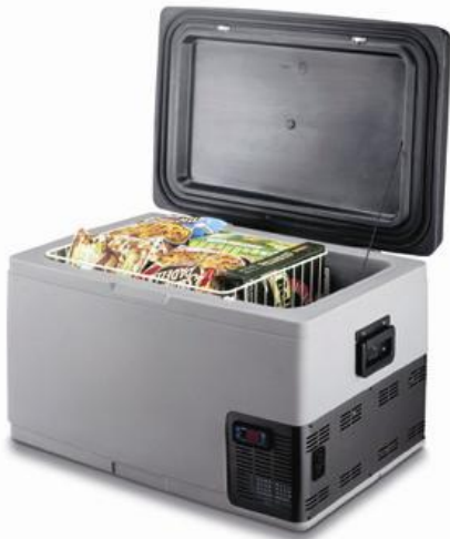
C 65L / C 65D C 65 D220